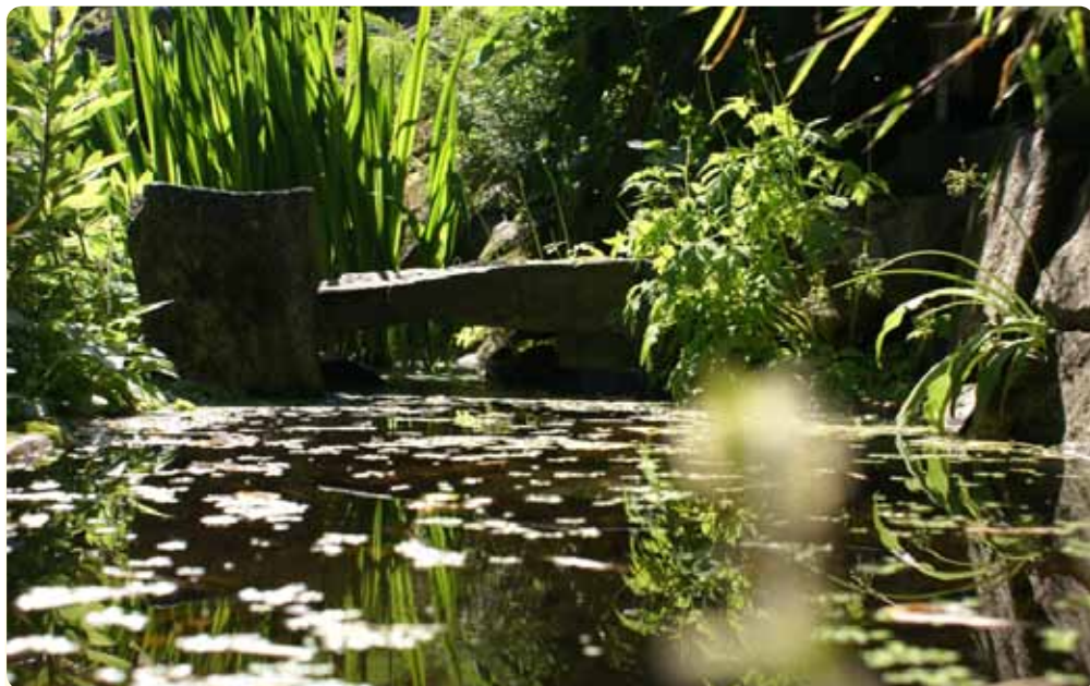
Bild: Bild från vinnande trädgård 2009

Ta chansen att vara med i tävlingen. Förutom fina priser kan du uppleva några av Huddinges allra mest spännande trädgårdar.