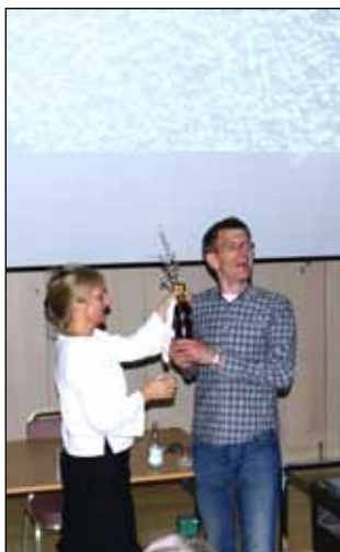
Avtackning med blommor efter ett lysande och medryckande föredrag. Många gick nu hem och började planera inför sommaren.