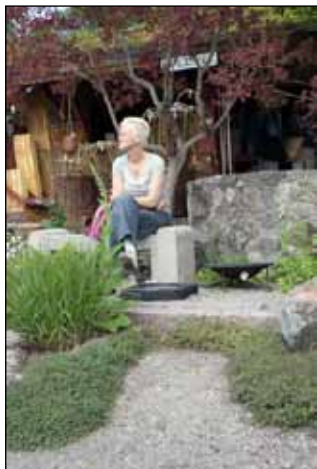
I sedvanlig ordning så skiner solen när innaren i Årets Trädgård ska kåras en paus innan prissermonin ska gå av stapeln.