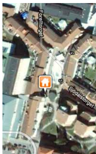
Konsten att hitta till Folkets hus i Huddinge. Besöksadress: Sjödalsorget 1